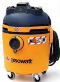
PC20 Tools Autoclean M