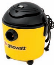
20P Shaker System