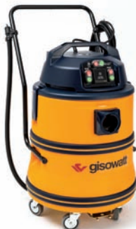
PC80 Twin Power Plastic