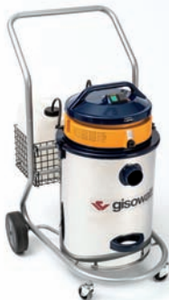
PCP50R Water Extraction System