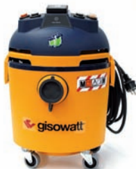
PC20 Tools Evolution M