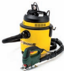
Maestro 20 Tools