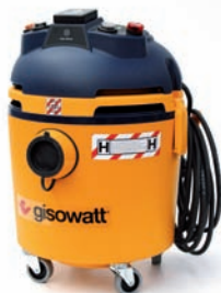
PC20 Tools Autoclean H