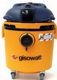
H Works 20