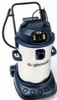
PC80 Twin Power Inox